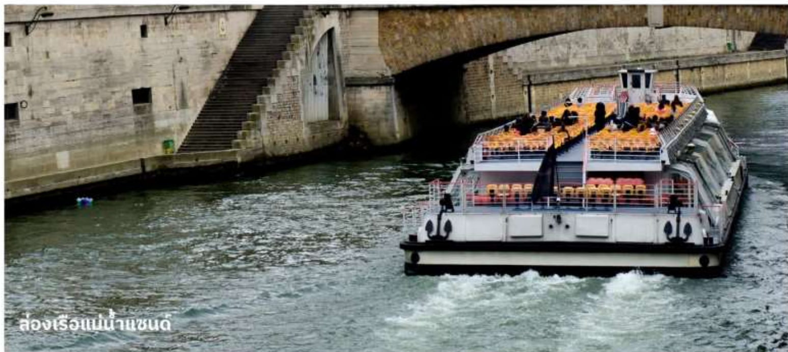
ล่องเรือแม่น้ำแซน