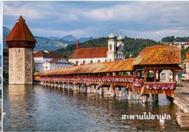
สะพานไม้ชาเปล

จากนั้นนำท่านชมและแวะถ่ายรูปกับ สะพานไม้ชาเปล หรือสะพานวิหาร (Chapel bridge) ซึ่งข้ามแม่น้ำรอยซ์ เป็นสะพานไม้ที่เก่าแก่ที่สุดในโลก มีอายุหลายร้อยปี เป็นสัญลักษณ์และประวัติศาสตร์ของเมืองลูเซิร์นเลยทีเดียว จากนั้นนำท่านเที่ยวชม รูปแกะสลักสิงโตบนหน้าผาหิน เป็นอนุสาวรีย์ที่ตั้งอยู่ใจกลางเมืองที่หัวของสิงโตจะมีโล่ห์ ซึ่งมีกากบาทสัญลักษณ์ของสวิตเซอร์แลนด์อยู่ อนุสาวรีย์รูปสิงโตแห่งนี้ออกแบบและแกะสลักโดย ธอร์ วอลเสน ใช้เวลาแกะสลักอยู่ราว 2 ปี โดยสร้างขึ้นเพื่อเป็นเกียรติแก่ทหารสวิส ในด้านความกล้าหาญ ซื่อสัตย์ จงรักภักดี ที่เสียชีวิตในประเทศฝรั่งเศส ระหว่างการต่อสู้ป้องกันพระราชวังในครั้งปฏิวัติใหญ่สมัยพระเจ้าหลุยส์ที่ 16