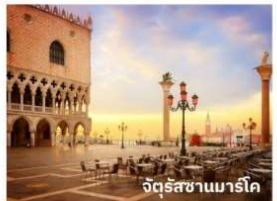
จัตุรัสซานมาร์โค

ท่านสามารถทำการสแกน QR CODE นี้ เพื่อรับชม เกาะเวนิส ในรูปแบบวิดีโอ