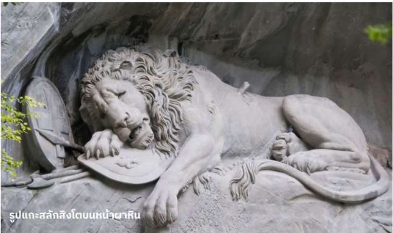
รูปแกะสลักสิงโตบนหน้าผาหิน

จากนั้นนำท่านชมและแวะถ่ายรูปกับ สะพานไม้ชาเปล หรือสะพานวิหาร (Chapel bridge) ซึ่งข้ามแม่น้ำรอยซ์ เป็นสะพานไม้ที่เก่าแก่ที่สุดในโลก มีอายุหลายร้อยปี เป็นสัญลักษณ์และประวัติศาสตร์ของเมืองลูเซิร์นเลยทีเดียว จากนั้นนำท่านเที่ยวชม รูปแกะสลักสิงโตบนหน้าผาหิน เป็นอนุสาวรีย์ที่ตั้งอยู่ใจกลางเมืองที่หัวของสิงโตจะมีโล่ห์ ซึ่งมีกากบาทสัญลักษณ์ของสวิตเซอร์แลนด์อยู่ อนุสาวรีย์รูปสิงโตแห่งนี้ออกแบบและแกะสลักโดย ธอร์ วอลเสน ใช้เวลาแกะสลักอยู่ราว 2 ปี โดยสร้างขึ้นเพื่อเป็นเกียรติแก่ทหารสวิส ในด้านความกล้าหาญ ซื่อสัตย์ จงรักภักดี ที่เสียชีวิตในประเทศฝรั่งเศส ระหว่างการต่อสู้ป้องกันพระราชวังในครั้งปฏิวัติใหญ่สมัยพระเจ้าหลุยส์ที่ 16