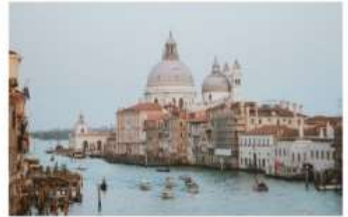
แกรนด์คาแนล

นำทุกท่านนั่งเรือต่อเพื่อไปยัง ท่าเรือซานมาร์โค (San Marco Pier) บนเกาะเวนิส แวะให้ท่านถ่ายรูปสวยๆ เก็บเป็นที่ระลึกกันที่ พระราชวังดอดจ์ พระราชวังริมน้ำแสนอลังการ ที่สร้างตั้งแต่ศตวรรษที่ 14 ในสไตล์เวเนเซียนโกธิค ที่เคยเป็นที่ประทับของผู้ปกครองของเวนิส แต่ตั้งแต่ปี 1923 ก็ได้เปลี่ยนเป็นพิพิธภัณฑ์ให้คนทั่วไปได้เข้าชม เป็นหนึ่งในแลนด์มาร์กหลักของเวนิส จากนั้นเดินเที่ยวชมแลนด์มาร์คสำคัญต่างๆ ในเมือง จัตุรัสเซนต์มาร์ค เป็นจัตุรัสหลักของเมืองเวนิส และยังเป็นศูนย์กลางเมืองตั้งแต่โบราณ จากนั้นนำท่านถ่ายรูปกับ มหาวิหารเซนต์มาร์ค มหาวิหารใหญ่ ของศาสนาคริสต์นิกายโรมันคาทอลิก อลังการด้วยการตกแต่งด้วยโดมใหญ่ และที่อยู่ติดกันและโดดเด่นด้วยความสูงถึง 50 เมตรก็คือ หอรบั้ง ถือเป็นหนึ่งในสัญลักษณ์ของเมืองที่ เห็นได้ไม่ว่าจะอยู่มุมไหนของเมืองก็ตาม และที่พลาดไม่ได้เลยก็คือ สะพานถอนหายใจ สะพานอันโด่งดังแห่งนี้ตั้งอยู่เหนือแม่น้ำที่คั่นกลางระหว่างคูเก่ากับพระราชวังดอดจ์