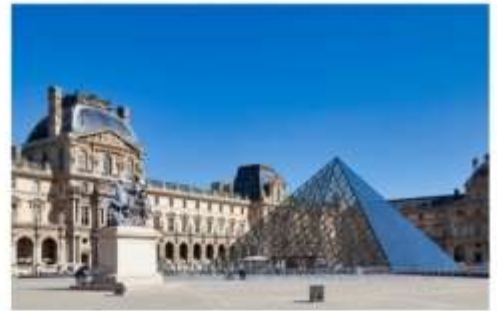
พิพิธภัณฑ์ลูฟร์

หลังจากนั้นนำท่านเดินทางสู่ La Vallee Village Outlet