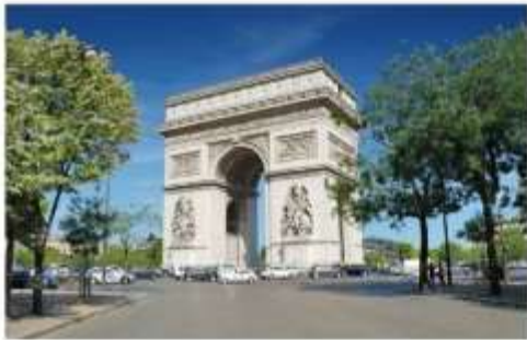
ประตูชัย

นำท่านเดินทางเข้าสู่ หอไอเฟล ถ่ายรูปเป็นที่ระลึกกับสัญลักษณ์ที่โดดเด่นสูงตระหง่านคู่นครปารีส จากนั้นนำท่านเดินทางเข้าสู่ย่านใจกลางเมืองปารีสเพื่อ ถ่ายรูปกับประตูชัย อีกหนึ่งสัญลักษณ์ของมหานครแห่งนี้ และเดินทางสู่ พิพิธภัณฑ์ลูฟร์ ให้ท่านได้ถ่ายรูปด้านหน้าพีระมิดแก้วของพิพิธภัณฑ์ลูฟร์ เป็นพิพิธภัณฑ์ทางศิลปะที่มีชื่อเสียงที่สุด เก่าแก่ที่สุดและใหญ่ที่สุดแห่งหนึ่งของโลก