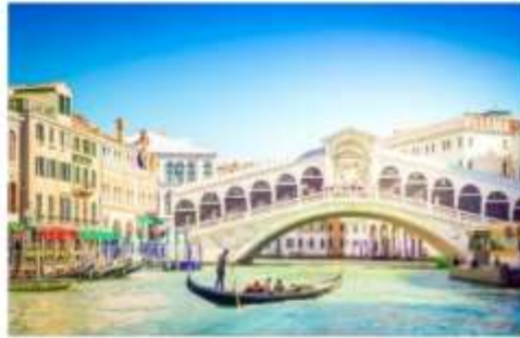
สะพานริอัลโต