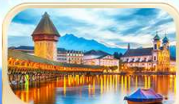
สะพานไมซ์ฮาเปล