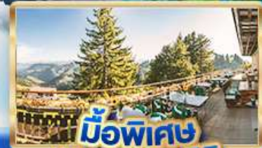
มือพิเศษ บียอดเวาริท