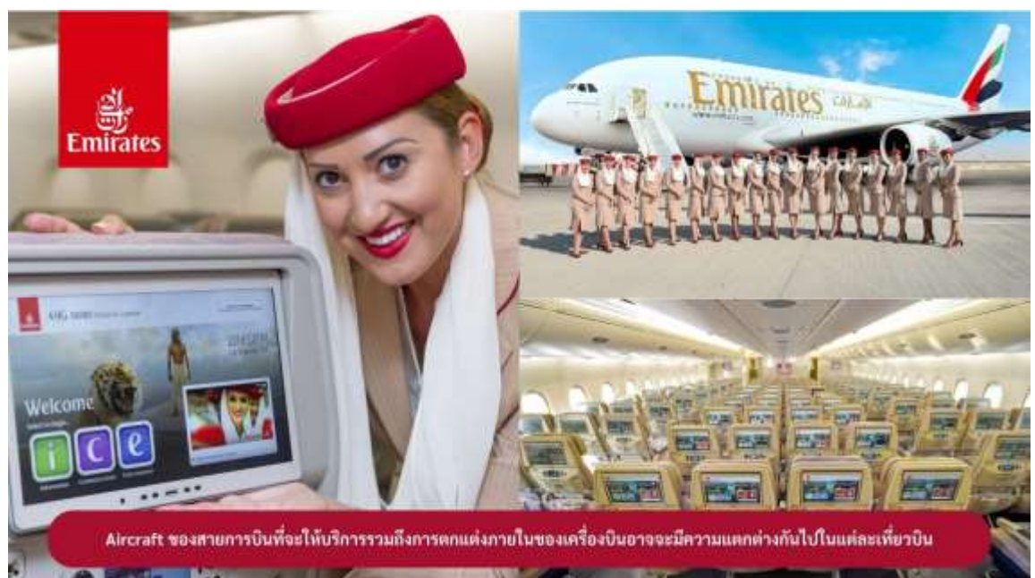
Aircraft ของสายการบินที่จะให้บริการรวมถึงการตกแต่งภายในของเครื่องบินอาจมีความแตกต่างกันไปในแต่ละเที่ยวบิน

23.00 น. !!!! ขณะเดินทางพร้อมกัน ณ สนามบินสุวรรณภูมิ อาคารผู้โดยสารขาออกระหว่างประเทศ ชั้น 4 ประตู 9 แถว T สายการบินเอมิเรตส์ แอร์ไลน์ (EK) เจ้าหน้าที่ให้การต้อนรับและอำนวยความสะดวก