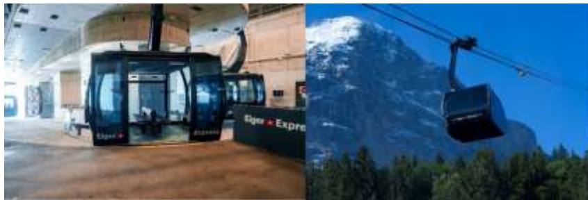
Highlight ! พิกัดยอดเขาจุงเฟรา โดยนักกระเช้า Eiger Express ที่ทันสมัยที่สุดใน ยุโรป ต่อด้วยรถไฟไต่เขาจากสถานีรถไฟที่ สูงที่สุดในยุโรป สมฉายา Top Of Europe

เช้า ๑๑ รับประทานอาหารเช้า ณ โรงแรม (มื้อที่5) นำท่านเดินทางไปสู่ สถานีกรินเดลวัลด์ (Grindelwald Terminal) (ระยะทาง 86 ก.ม./ 1.45 ชม.) เพื่อขึ้น กระเช้าลอยฟ้าไอเกอร์เอ็กเพรส (Eiger Express) สู่ สถานีไอเกอร์เกลตเชอร์ (Eigergletscher) ซึ่งเป็นจุด เชื่อมต่อให้ท่านเปลี่ยนขึ้นรถไฟจุงเฟราเพื่อนำท่านสู่ยอดเขาจุงเฟรา (JUNGFRAUJOCH) ซึ่งเป็นสถานีรถไฟที่ สูงที่สุดในยุโรป ที่ความสูง 3,454 เมตร