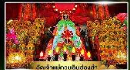
วัดเจ้าแม่กวนอิมฮ่องฮำ