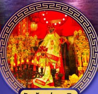
วัดเจ้าแม่กวนอิม ฮองฮา