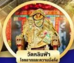
วัดหลินฟ้า โชคลาภและความมั่งคั่ง