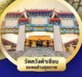
วัดหวังต้าเซียน ขอพรด้านสุขภาพ