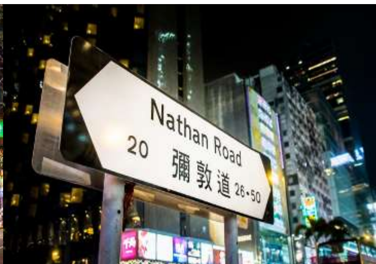
กลางวัน อิศระอาหารกลางวันตามอัธยาศัย เพื่อความสะดวกในการท่องเที่ยว