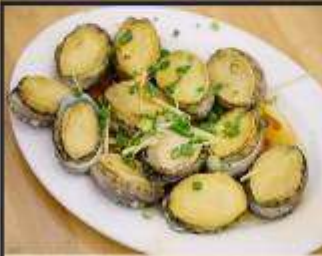
เปาฮ้อสดหนึ่ง