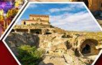
เมืองดำอพิลิสต์ซเคห์