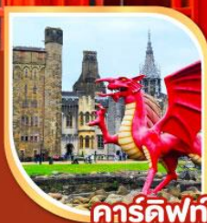
คาร์ดิฟฟ์