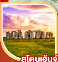
สโตนเฮ็นจ์