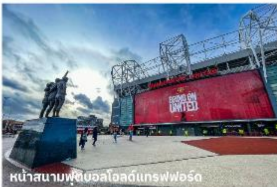
หน้าสนามฟุตบอลโอลด์แทรฟฟอร์ด