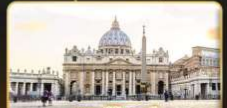
เซนต์ปีเตอร์