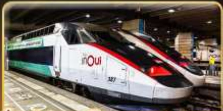
นั่งรถไฟความเร็วสูง PARIS - LYON