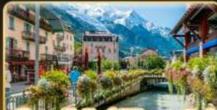
เยือนซาโมเน็กซ์ พิชิตมงบล็องก์