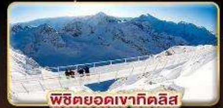
พิชิตยอดเขาทิตลิส