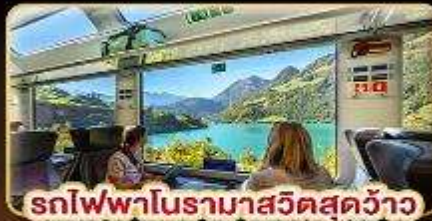
รถไฟฟ้ามหานครสวยสุดวิว