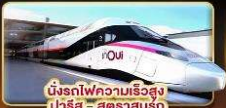
นั่งรถไฟความเร็วสูง ปารีส - สตราซบูร์ก

📅 เดินทางเทศกาลสงกรานต์ 06-14 และ 08-16 เม.ย. 68