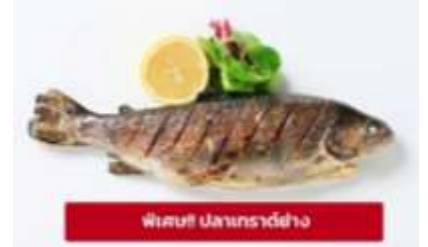
ฟิชซูฟ ปลาเทราต์ย่าง

ช่วยรอดพ้นภัยทั้งจากโรคระบาด และการโจมตีของกองทัพอดโตมันมาได้ มหาวิหารเก่าลินซ์ (Old Cathedral) หรือเรียกอีกอย่างว่าโบสถ์อิกเนเชียส ที่นี่ทำหน้าที่เป็นอาสนวิหารของสังฆมณฑลลินซ์ โรงละครลินซ์ (Neues Musiktheater) สร้างขึ้นระหว่างปี 2008 ถึง 2013 ทำหน้าที่เป็นโรงละครและโรงโอเปร่าของเมืองลินซ์