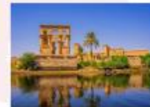
วิหารฟิเล

16.25 น. ออกเดินทางสู่กรุงไคโร สายการบิน Egypt Airlines เที่ยวบิน MS295