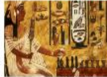
หุบผาซัคเรีย