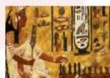
พิพิธภัณฑ์สถานแห่งชาติอียิปต์