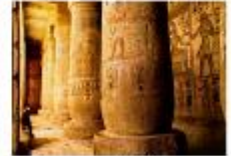
วิหารมาดินัตอาบู

** พักที่ Royal Beau Rivage Nile cruise 5* หรือเทียบเท่า **