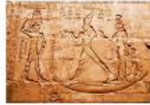
วิหารเอ็ดฟู