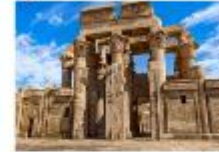
วิหารคอมมอมโบ