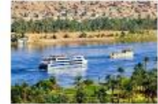
พักผ่อนตามอัชฌาศัย บนเรือสำราญ

** พักที่ Royal Beau Rivage Nile cruise 5* หรือเทียบเท่า **