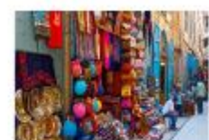
ตลาดข่านเอลคาลิลี

20.50 น. ออกเดินทางสู่อิสตันบูล เที่ยวบิน TK695