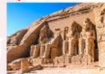
มหาวิหารอาบูซิมเบล

** พักที่ Royal Beau Rivage Nile cruise 5* หรือเทียบเท่า **