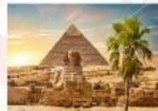
มหาพีระมิดกิซา

** พักที่ Eurostars Granada Hotel 4* หรือเทียบเท่า **