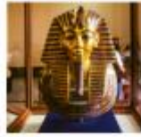
The Egyptian Museum

** พักที่ Mamlouk Pyramids Hotel 4* หรือเทียบเท่า **