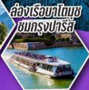
ล่องเรือบาโตมูซ ชมกรุงปารีส

เที่ยวเมืองวาอูซ เมืองหลวงของสาธารณรัฐ ลิกเทนสไตน์