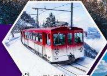
นั่งรถไฟใต้เขาริกิ