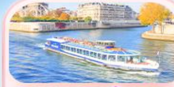
คลองเรือแม่น้ำเซน