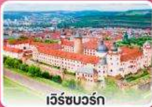
เวิร์ชบวร์ค