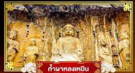
กำแพงหลงเหมิน