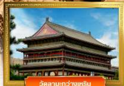
วัดลามะ-กว่างเหฺริน