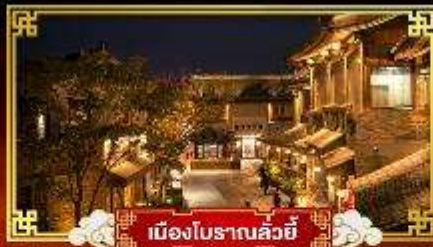
เมืองโบราณลั่วหยี่