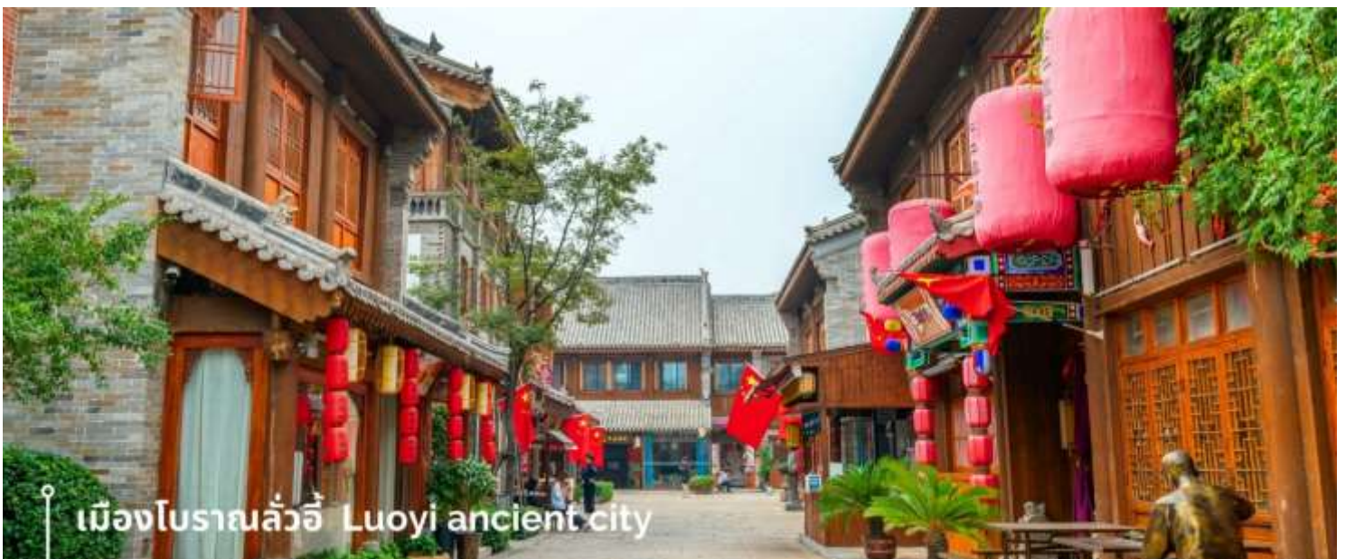
เมืองโบราณลั่วอี้ Luoyi ancient city

นำท่านเที่ยวชม เมืองโบราณลั่วอี้ เป็นสถานที่ท่องเที่ยวระดับ 1A ตั้งอยู่ในเมืองเก่าของเมืองลั่วหยาง เมืองหลวงโบราณของราชวงศ์ทั้ง 13 ราชวงศ์ บรรยากาศคอบอวลไปด้วยเสน่ห์แบบจีนโบราณ ที่ยังคงอยู่มายาวนานหลายร้อยปี เมื่อเดินเล่นผ่านเมืองโบราณลั่วอี้ จะเห็นสถาปัตยกรรมบ้านเรือน ที่มีชายคาซ้อนกันเป็นชั้นๆ และกำแพงเมือง สนามหญ้า