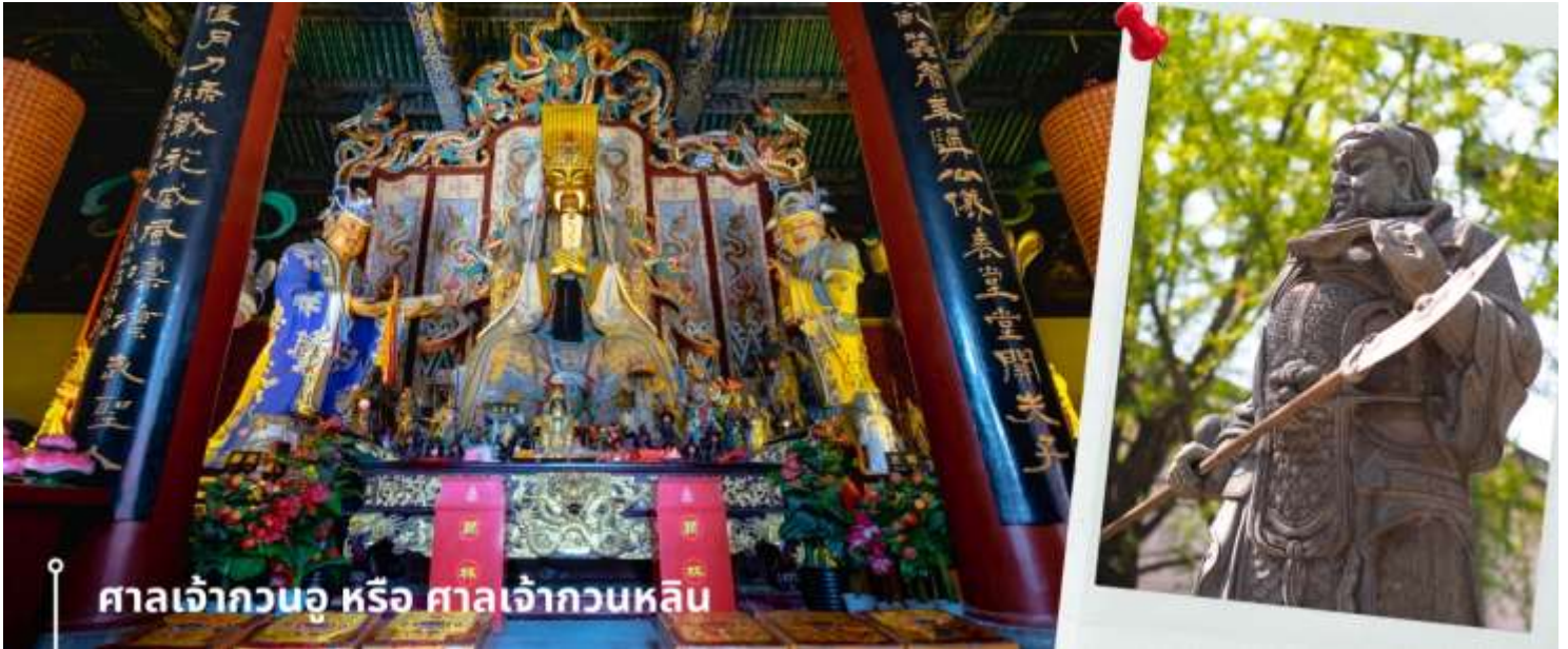
ศาลเจ้ากวนอู หรือ ศาลเจ้ากวนหลิน

นำท่านเดินทางไปยัง ศาลเจ้ากวนอู หรือ ศาลเจ้ากวนหลิน ในเมืองลั่วหยาง ตั้งอยู่ทางใต้ของเมืองลั่วหยาง มีประวัติศาสตร์กล่าวว่าที่นี่เป็นสถานที่ฝังศพของแม่ทัพกวนอู ผู้จงรักภักดีในสมัยพระเจ้าฮั่นเหี้ยนเต้ ก่อนถึงตำแหน่งที่ประดิษฐานเทพเจ้ากวนอู จะมีแนวต้นไม้และสิ่งโศกหินจำนวน 104 ตัว ตั้งเรียงรายอยู่สองข้างทางเดิน พร้อมผ้าสีแดงสดเขียนคำอวยพรผูกอยู่กับตัวสิ่งโศก รวมถึงยังมีแผ่นกระดาษให้เขียนขอพรและนำไปแขวนไว้ตามกิ่งไม้