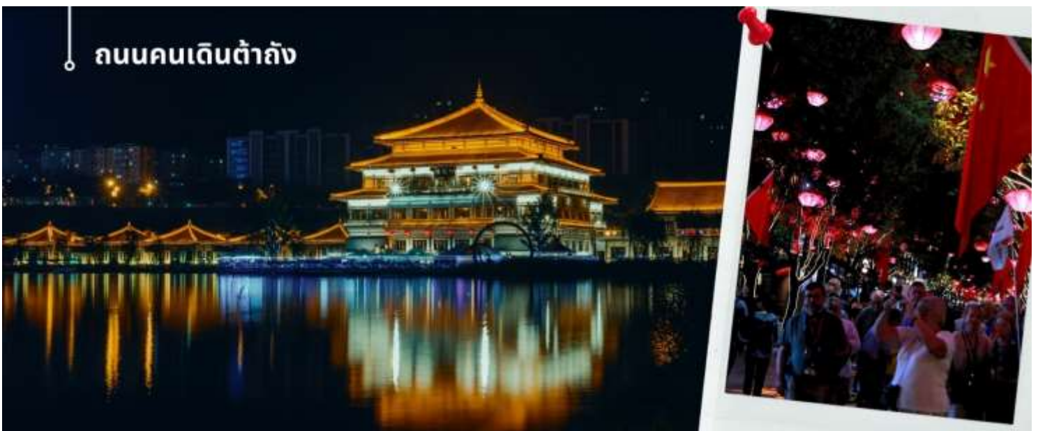
ถนนคนเดินต้าถั่ง

นำท่านเดินทางต่อไปยัง ถนนคนเดินต้าถั่ง ตั้งอยู่ใกล้กับเจดีย์ห่านป่าใหญ่ ถนนคนเดินต้าถั่งเป็นถนนวัฒนธรรมที่จำลองกลิ่นอายจีนแบบย้อนยุคของราชวงศ์ถัง มีการแสดงดนตรีสด แสงไฟที่ประดับประดา และร้านค้าที่ขายสินค้าพื้นเมือง