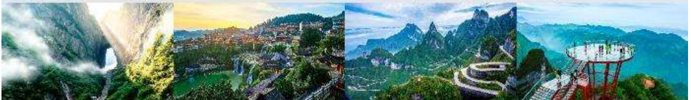
ประตูละคร