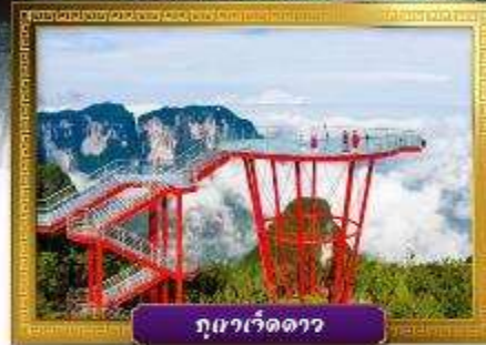
ภูเขาเจ็ดดาว

✓ เดินเล่นถนนคนเดินหลงชิ่งลู่และซีปู้เจีย