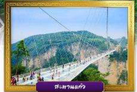
สะพานแก้ว