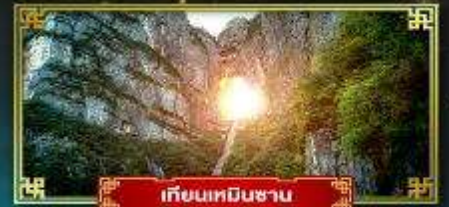
เทียนเหมินซาน