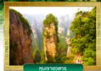
หินเงาอวดสาร