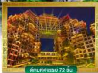
ตึกมหัศจรรย์ 72 ชั้น