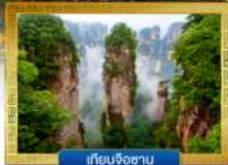
เทียนจื่อซาน