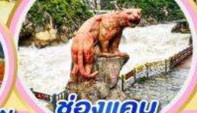
ช่องแคบ เสือกระโจน