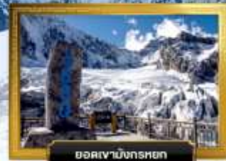
ยอดเขามังกรหยก