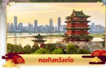
หอถังหวิ่งกู่