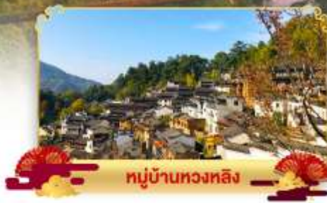
หมู่บ้านหวงหลิ่ง