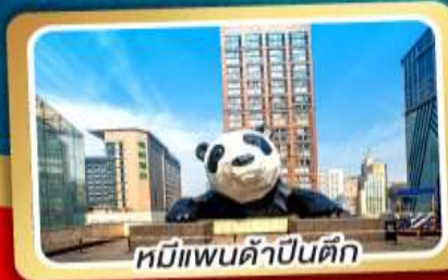
หมีแพนด้าปิ่นตึก