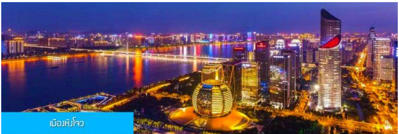
เมืองฮังโจว