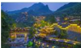
หุ่นเขาเทวดาวิ่งเซียนทู่