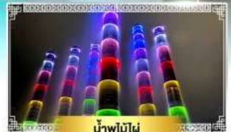
น้ำพุไม้ไผ่