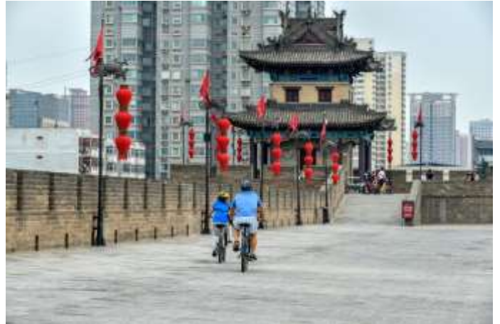
พาท่านชม วัดลามะกว้างเหริน (Guangren Temple)

นำท่านไป กำแพงเมืองโบราณซีอาน (Xi'an City Wall ) (ระยะทางและเวลาเดินทางขึ้นอยู่กับโรงแรมที่พัก)สร้างขึ้นในสมัยราชวงศ์หมิงมีความยาว 14 กิโลเมตร และมีความสูง 39 ฟุต ปัจจุบันทรุดโทรมแต่ยังคงล้อมรอบเมืองซีอานอยู่และได้มีการบูรณะให้อยู่ในสภาพเดิม โดยด้านนอกจัดเป็นสวนสาธารณะให้ผู้คนเข้ามาเที่ยวชมและพักผ่อน