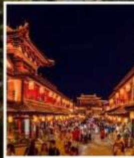
ถนนคนเดินว่านโซ่วกง