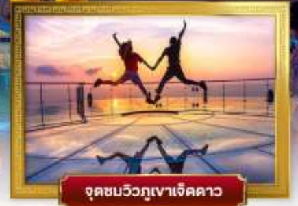
จุดชมวิวกูเขาเจ็ดดาว