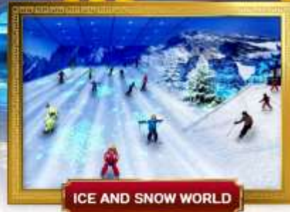
ICE AND SNOW WORLD