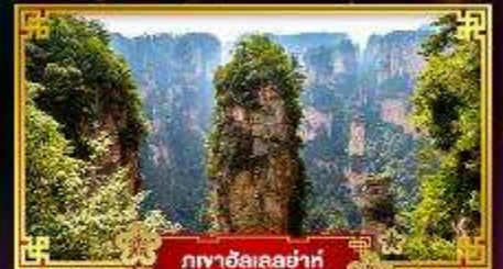
ภูผาฮัลเลอฮ่าห์