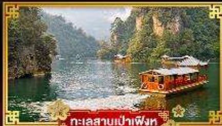
ทะเลสาบเป่าฟิ่งหู