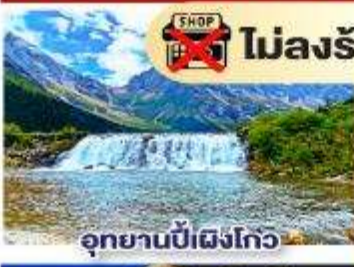
อุทยานปีฝั่งโกว