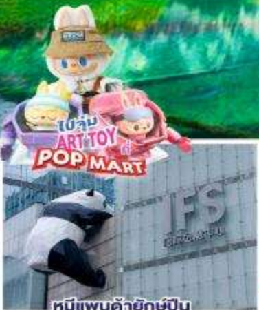
หมีแพนด้ายักษ์ปีน ตึกถนนชุนซีลู่

12-17, 14-19, 15-20 เม.ย.68 17-22, 18-23, 19-24, 21-26 เม.ย. 68 22-27, 24-29 เม.ย.68 / 27 เม.ย. - 02 พ.ค. 68 29 เม.ย. - 04 พ.ค.68 / 02-07, 09-14 พ.ค. 68 11-16, 16-21, 18-23, 23-28 พ.ค.68 30 พ.ค. - 04 มิ.ย.68