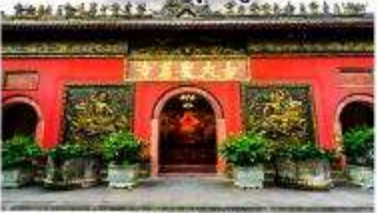
วัดต้าเจี๊ว