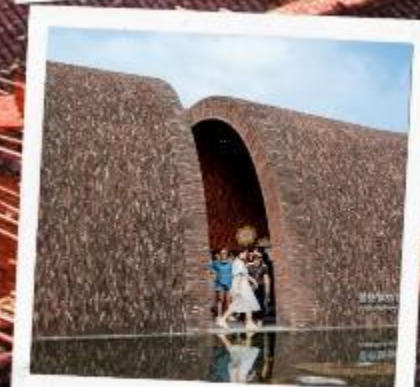
จิ้งเต๋อเจิ้น