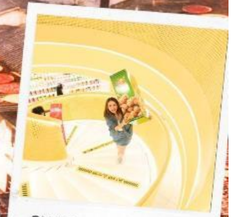
SNACK BUSY STATION