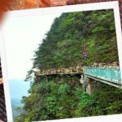
หมิงเยวี่ยซาน