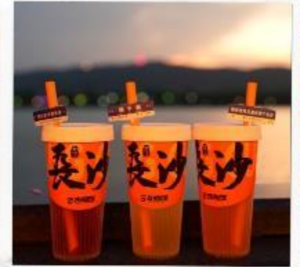
เซียงเจียงริเวอร์ไซด์