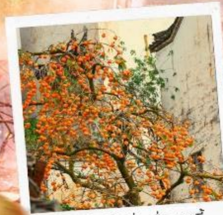
柿柿如意 ชื่อ ชื่อ หยูอี้ ลูกพลับแห่งความราบรื่น