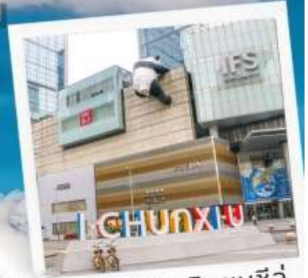
ถนนคนเดินชุนซีลู่