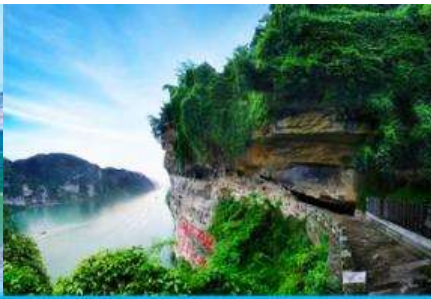
สวนถ้ำสามสหาย