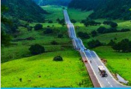
อุทยานเขานางฟ้า