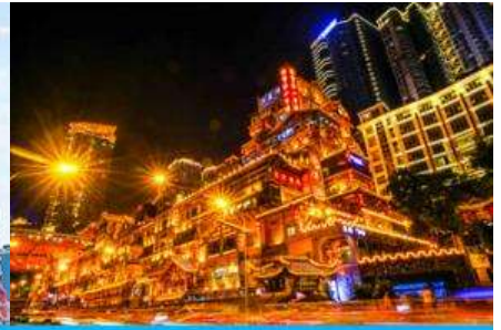
ย่านหงหยาดัง

วันที่ห้า เมืองอู่หลง-นครฉงชิ่ง-มหาศาลาประชาชน-ชมรถไฟทะเลติก-เช็คอินย่านหงหยาดัง