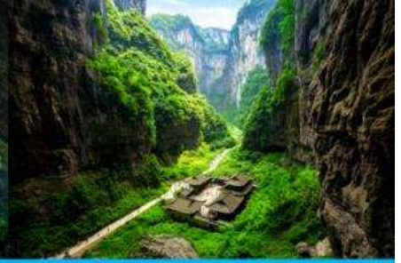
สะพานธรรมชาติสามแห่ง