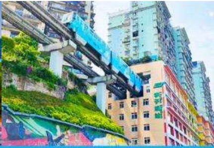
รถไฟวิงทะเลติก