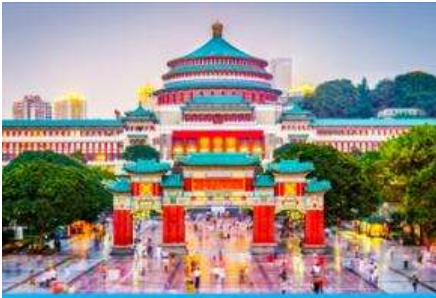
ศาลาประชาชน