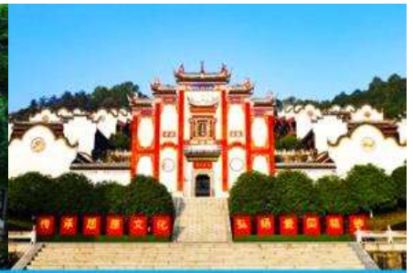
บ้านเกิดกวี ขวี่หยวน