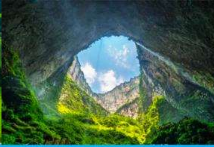
อุทยานหลุมฟ้า