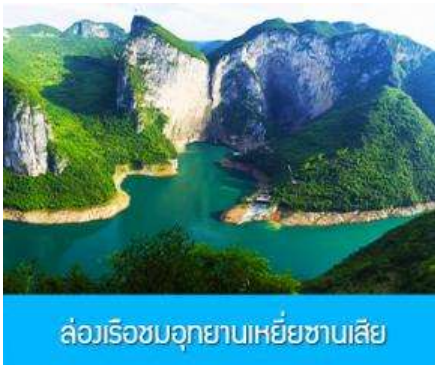
ล่องเรือชมอุทยานเหี้ยซานเสี๋ย