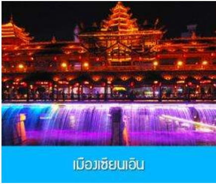
เมืองเซี่ยเหมิน