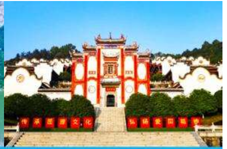
บ้านเกิดกวี ขวี่หยวน