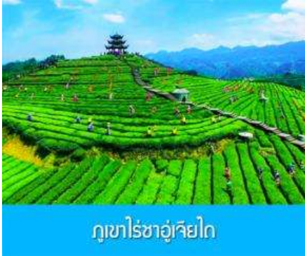
ภูเขาไร่ชาอู่เจียไถ

พักที่ โรงแรม ENSHI XIPU HOTEL ระดับ 4 ดาวท้องถิ่นหรือเทียบเท่าในเมืองเินซือ