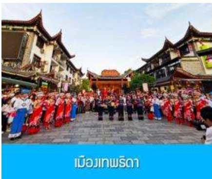
เมืองเทพธิดา