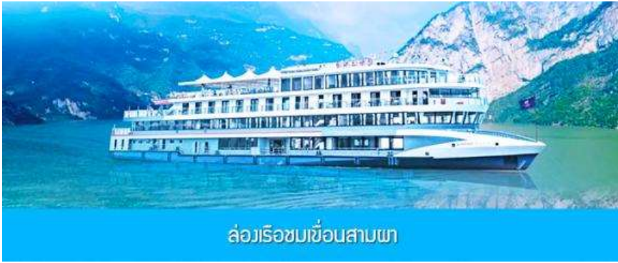
ล่องเรือชมเขื่อนสามผา