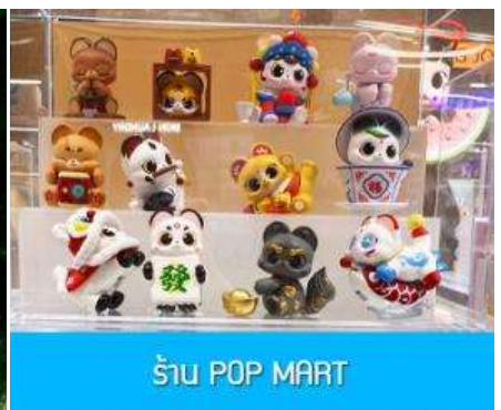
ร้าน POP MART