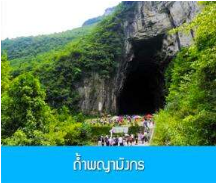
ถ้ำพญามังกร