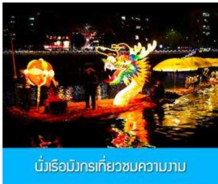
นั่งเรือมังกรเที่ยวชมความงาม