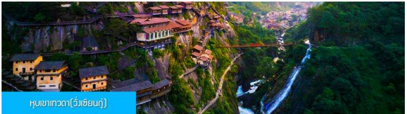
หุบเขาเทวดา(วังเซียนกู่)

หลังอาหารเช้าท่านเดินทางสู่เมือง ซังเหรา 上饶 (ระยะทาง 127 กม. ใช้เวลาเดินทางโดยรถบัสราว 2 ชั่วโมง)