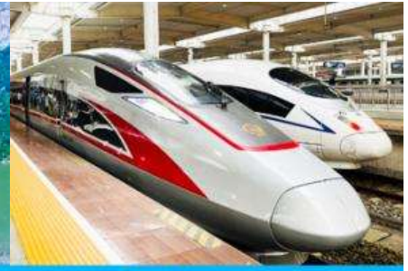
นั่งรถไฟความเร็วสูง