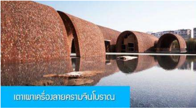
เตาเผาเครื่องลายครามจินโบราณ