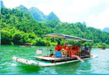
ล่องแพไม้ไผ่