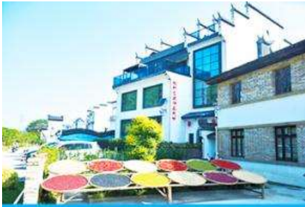
หมู่บ้านโบราณ สือเหมินซุน