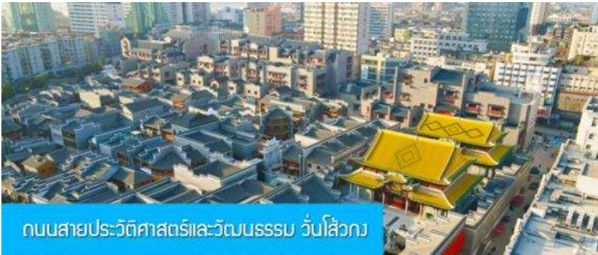
ถนนสายประวัติศาสตร์และวัฒนธรรม วันโสิ่วกง