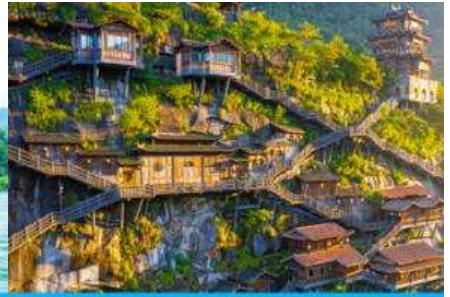
อุทยาน วังเซียนกู่

วันที่ 1 เมืองวู่หยวน-หมู่บ้านโบราณเหยียนสือเหมินซุน-ล่องแพไม้ไผ่ - เมืองซังเหรา - หุบเขาเทวดาวังเซียนกู่