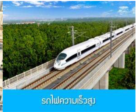
รถไฟความเร็วสูง