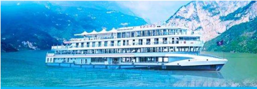
ล่องเรือชมเขื่อนสามผา