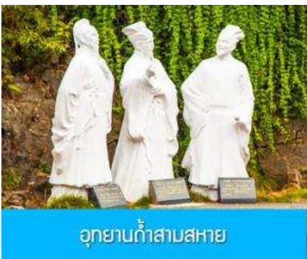
อุทยานก้ำสามสหาย

ค่ำ รับประทานอาหารค่ำ ณ ภัตตาคาร หลังอาหารเช้าท่านเข้าสู่โรงแรมที่พัก พักที่ XIA ZHOU BINGUAN HOTEL โรงแรมระดับ 4 ดาวหรือเทียบเท่าใจกลางเมืองหยีชาง