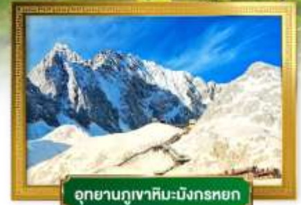
อุทยานกุเวาหิมะมังกรหยก

เดินทางโดยสายการบินโซน่าอีสเทิร์นแอร์ไลน์