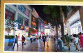
ถนนซุนซีลู่