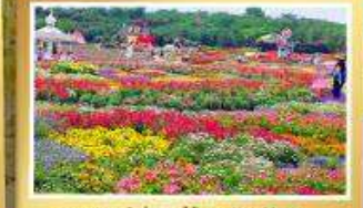
สวนสวรรค์แห่งดอกไม้ Manhua Manor