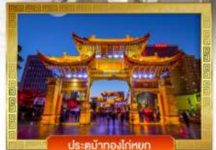
ประตูม้าทองโก่หยก