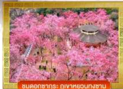
ชมดอกซากุระ ภูเขาหยวนกงซาน