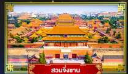
สวนจิ่งซาน