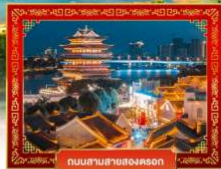
ถนนสามสายสองคอน