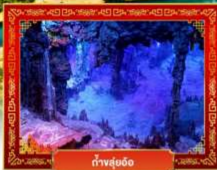
ถ้ำสุ่ยอ้อ