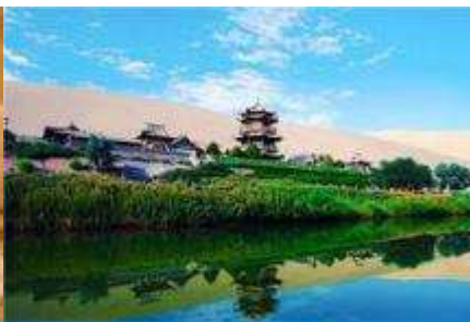
สระบัววพระจันทร์