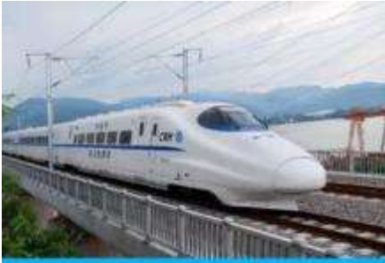
นิ่วรถไฟความเร็วสูง