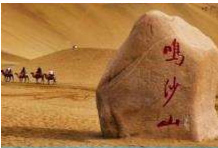
เนินทรายหมีซาซา

หลังอาหารให้ท่าน มีเวลาเดินเล่น ช้อปปิ้งใน ตลาดกลางคืน ซาโจว 沙洲夜市 ให้ท่านเลือกซื้อของที่ระลึกของเส้นทางสายไหมได้ตามอัธยาศัย