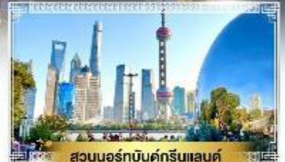
สวนนอร์ทัมดกรีนแลนด์