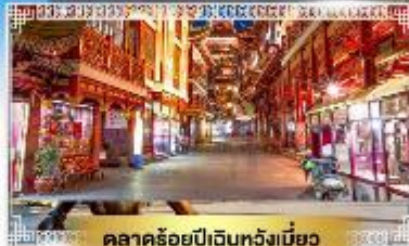
ตลาดร้อยปีฉินหวงเหมียว